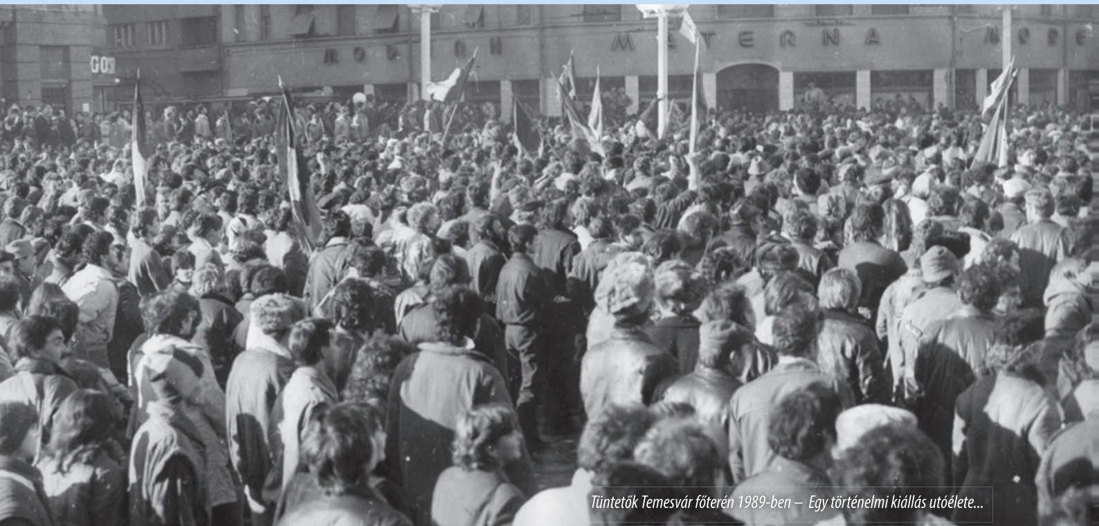
Tüntetőik Temesvár főterén 1989-ben – Egy történelmi kiállítás utóélete...

Tizenegy európai képviselő szintén levélben fordult Victor Ponta kormányfőhöz, amelyben Tőkés László szerepét méltatták a romániai rendszerváltozásban,