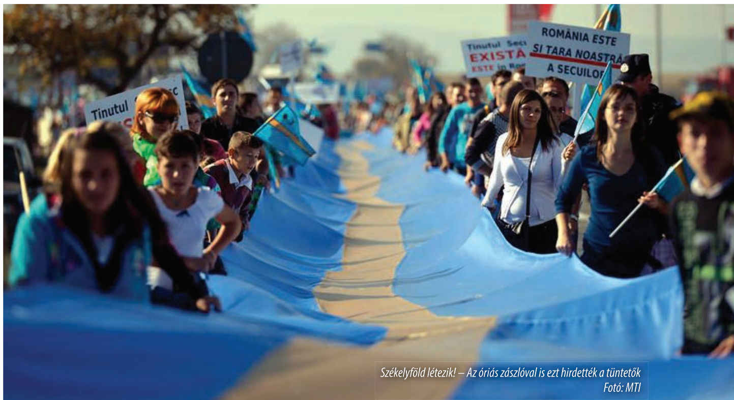
Székelyföld létezik! – Az óriás zászlóval is ezt hirdették a tüntetők

A Kököstől Bereckig terjedő Székelyföldi Nagy Menetelés tizennégy helyszínének egyikén, Maksán, a református templom előtti téren vasárnap délelőtt több ezren gyűltek össze azon a szabadtéri istentiszteleten, melyen Tőkés László , a Királyhágómelléki Református Egyházkerület (KRE) volt püspöke, EP-képviselő, az Erdélyi Magyar Nemzeti Tanács (EMNT) elnöke hirdette Isten ígétjét.