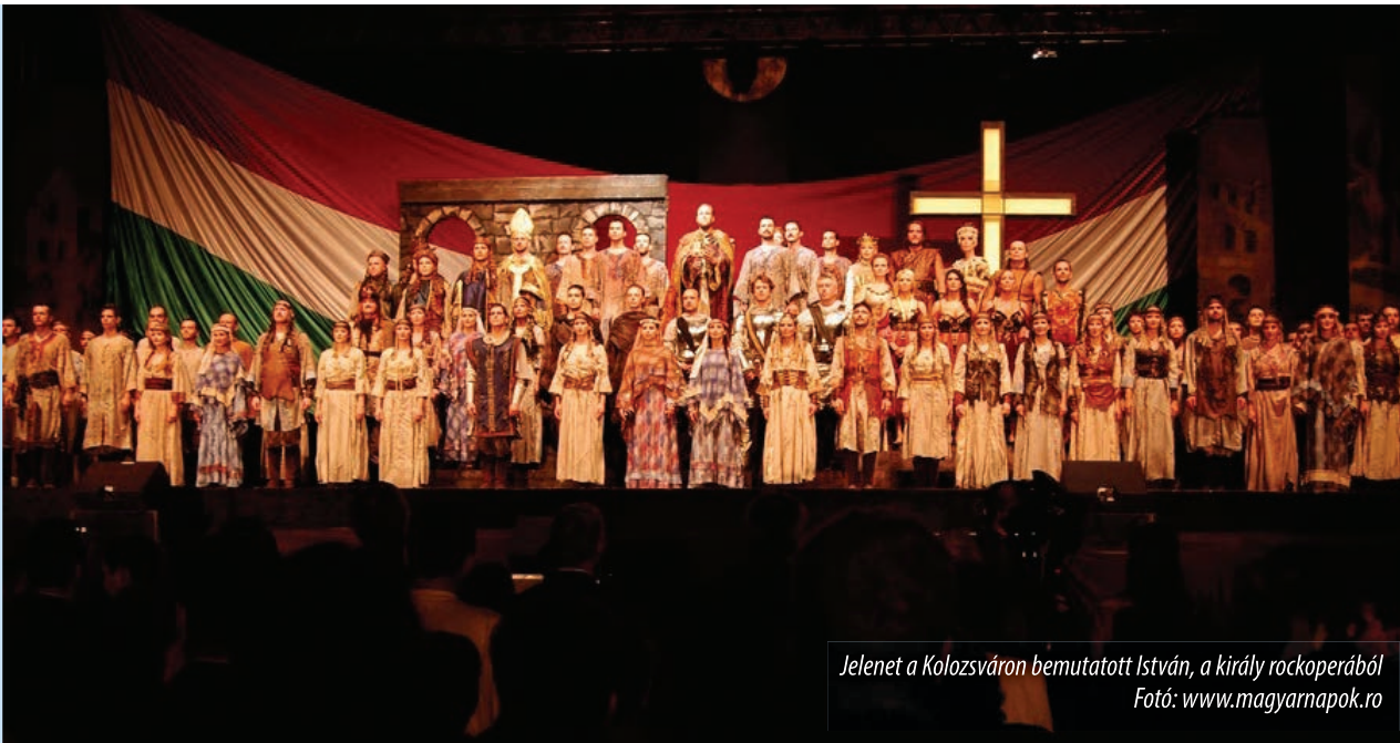
Jelenet a Kolozsváron bemutatott István, a király rockoperából