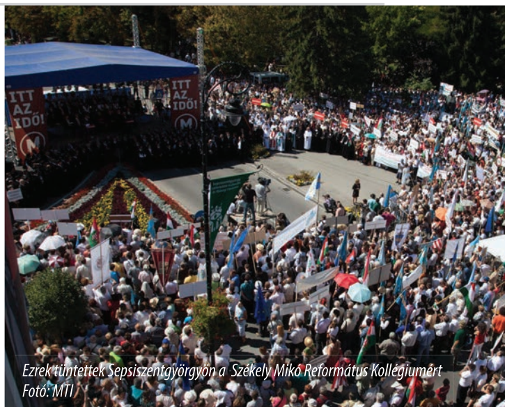
Ezrek tüntettek Sepsiszentgyörgyön a Székely Mikó Református Kollégiumért