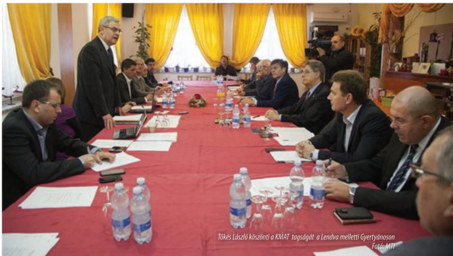
Tőkés László köszönti a KMAT tagságát a Lendva melletti Gyertyánoson

A Kárpát-medencei Magyar Autonómianács (KMAT) továbblépést szorgalmaz a kisebbségügyi európai polgári kezdeményezések elutasítása nyomán, kiemelt fontosságúnak tartja a külföldi magyarok részvételét a 2014-es magyarországi választásokon, elutasítja a román és a szlovák kormány magyar közösségek számára kedvezőtlen régiósítási törekvéseit, ugyanakkor támogatja a Székelyek Nagy Menetelését és határozottan ellenzi a Kárpát-medencében tervezett veszélyes bányaberuházásokat.