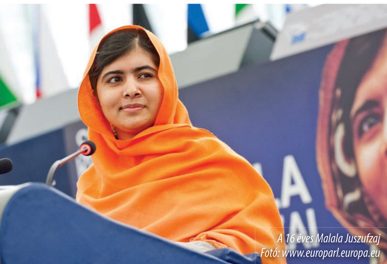
A 16 éves Malala Jusufzaj