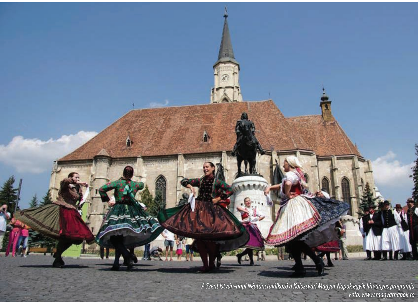
A Szent István-napi Néptáncfaló a Kolozsvári Magyar Napok egyik látványos programja

Elhangzott a IV. Kolozsvári Magyar Napok nyitógáláján, Kolozsváron, 2013. augusztus 19-én.