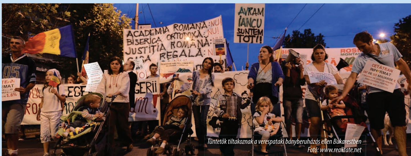
Tüntetőik tiltakoznak a verespataki bányaberuházás ellen Bukarestben