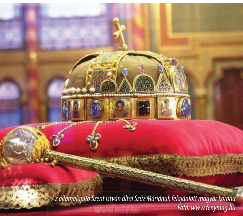
Az államalapító Szent István által Szűz Máriának felajánlott magyar korona

Tőkés László európai parlamenti képviselő, az EMNT elnöke