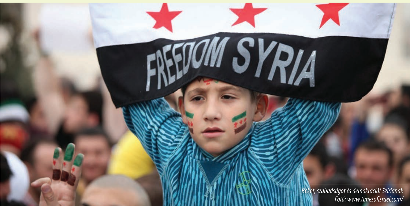
Békét, szabadságot és demokráciát Szíriának

A fideszes EP-képviselő plenáris felszólalásában rámutatott: a lakossági devizahitel-állomány Magyarországon az egyik legnagyobb, ami azért alakulhatott ki, mert a bankárok ahelyett, hogy a devizahitelezés valós kockázataira figyelmeztettek volna, még felelőtlen kockázatvállalásba is hajszolták a hitelfelvevőket, így